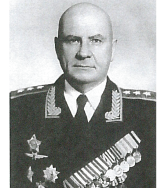
Генерал-полковник авиации Толстикова О.В. Первый заместитель Министра внутренних дел СССР по МПВО с 1956 г. по 1961 г.

5-6 октября 1948 года произошло землетрясение в столице Туркмении г. Ашхабаде, в результате которого число погибших составило свыше 176 000 человек. 240 тяжелых транспортных самолетов МПВО доставили в Ашхабад 1 265 медиков, 48 тонн медикаментов, 240 тонн продуктов, 5 тысяч армейских палаток.