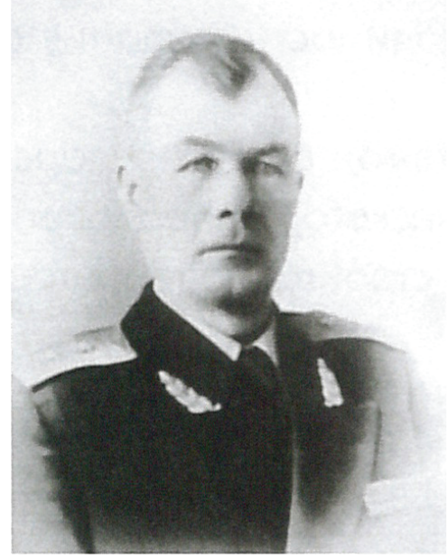
Генерал-лейтенант Шередега И.С. Начальник ГУ МПВО МВД СССР с 1950 г. по 1956 г.